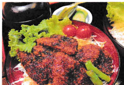
なごみ豚のタレカツ丼